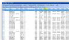
Selektierte Adressliste für die Einladung